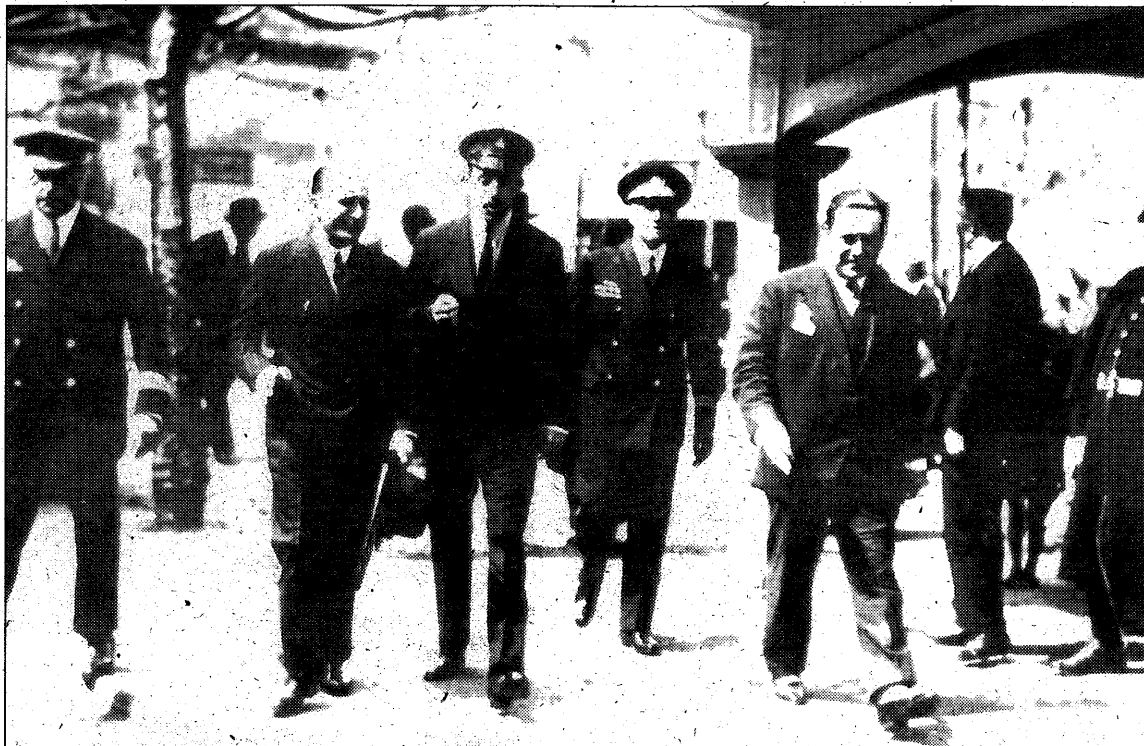
Fotografía de la visita de Alfonso XIII a la entonces Alcaldía de Buenavista, uno de los fondos del archivo.

Así, entre las fotografías que se ofrecen está una de la visita de Alfonso XIII a lo que hoy se conoce