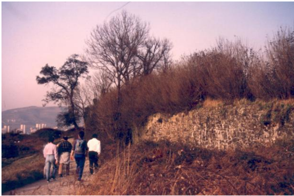
Garbera Goiako harresia (Joxerra Fernandez)