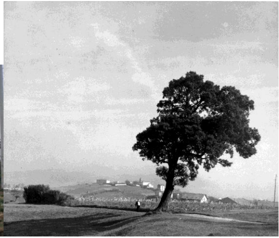
Garberako artea (Fco. Armendariz)