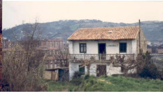
Londres (Joxerra Fernandez)