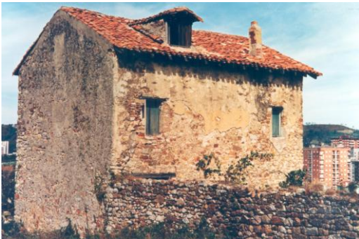
Paris (Rosa Batalla)