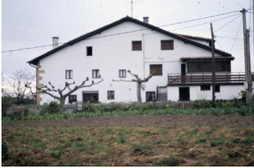
Garbera Bea (Angel Calvo)