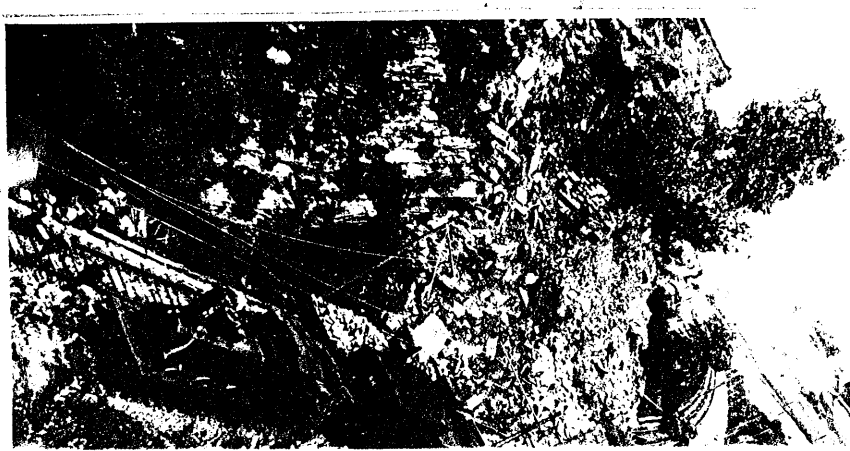
En la línea del ferrocarril del Norte, entre Herrera y Ategorrieta, ocurrió ayer un desprendimiento de tierras, que interceptó el tráfico ferroviario. En la fotografía se aprecia la importancia del accidente. Al lugar acudió el gobernador civil, y se trabaja activamente para dejar expedita la vía férrea. (VÉA INFORMACION EN SEGUNDA PAGINA)