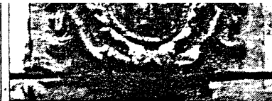
Un San Jerónimo medieval y el escudo de Altza, dos piezas interesantes de Altza.