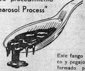
Este fango negrozco y pegajoso está formado por los componentes de naturaleza resino-alquitranosa que se encuentran en todos los petróleos crudos y que son causa de la gomosis sobre los vástagos de las válvulas, carbonilla, peso en el cárter y en condiciones particularmente duras de servicio acarrean el agarramiento de los aros del pistón.

Esto es lo que se elimina con el nuevo procedimiento "Clearosol Process"