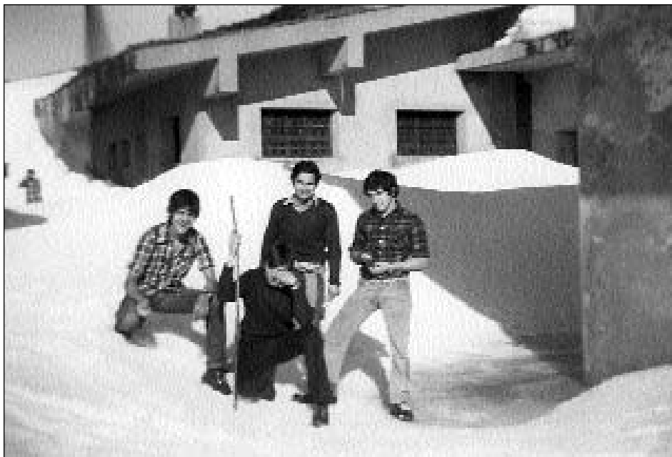
Gazteleku "Espedizioa" Igaratzen

bidea apalago agertuko zaigu, eta ziztu batez, Perileku deitutako belardietan aurkituko gara; duela berrogei edo berrogeita hamar arte, aspaldidanik, han egiten zituzten Aralarreko artzaiek bilerak; S. Juan bezperan egiten omen zituzten; saldu eta erosi egiten zuten, baita ere ahariak trukutzen zituzten artaldeak hobetzeko asmoz. Hemen belarra bai biguina dela, benetan atsegina gure oinentzat. Bide konkreturik ez dago eta, laino egunetan ez da zaila alde honetan galtzea. Belardi erdian norabidezko plaka bat ezarrita dago, plaka honetan, bertatik, inguruko mendi eta herrietara distantziak grabatutak aurkituko ditugu, helbideez gain. Hortik bost minututara, gure arbasoen bi aztarna aurkituko ditugu, bi jentilarri hain zuzen ere (1152 m.); bata bestearen ondoan, "Ipar Igaratza" eta "Hego Igaratza"; hemen, indusketak egiterakoan, gauza interesgarri batzuk aurkitu ziren: lepokoak, keramikazko eltze zatiak, brontzeko punzoi bat, giza hezurak, eskumuturrekoak, e.a.